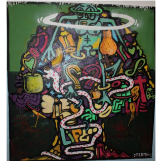
Murales II.PP di Parma

Il carcere può essere osservato come una vera e propria città in miniatura, un microcosmo che riflette, in forma distorta, le dinamiche della vita all'esterno. Il carcere, così complesso e gerarchico, rende evidente quanto non sia solo un luogo di detenzione fisica, ma anche un sistema sociale a sé stante, le relazioni, i ruoli, le regole e le gerarchie definiscono la quotidianità tanto quanto le mura e le sbarre. Dentro le mura, la vita continua secondo regole proprie, e chi vi entra deve imparare a muoversi come se fosse un cittadino di un microcosmo parallelo, con la consapevolezza che la libertà in carcere è relativa